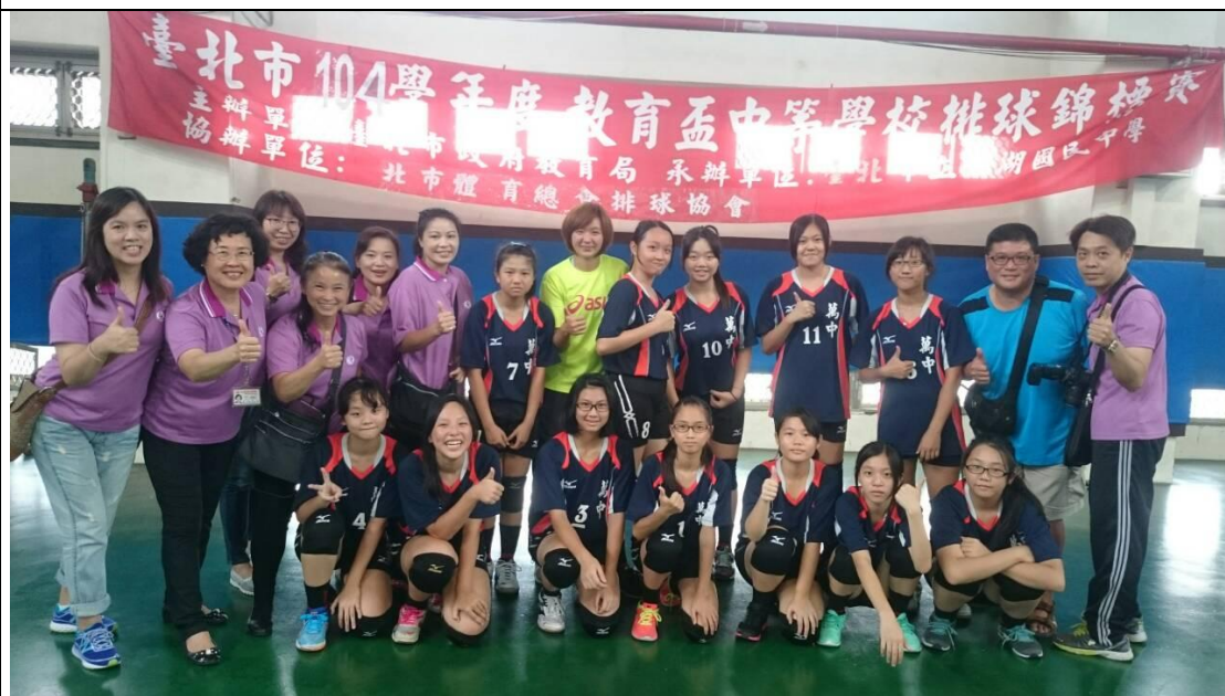
圖說：代表學校參加教育盃中等學校排球錦標賽