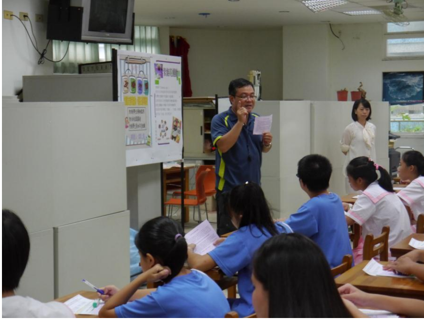
圖說：社團上課情形