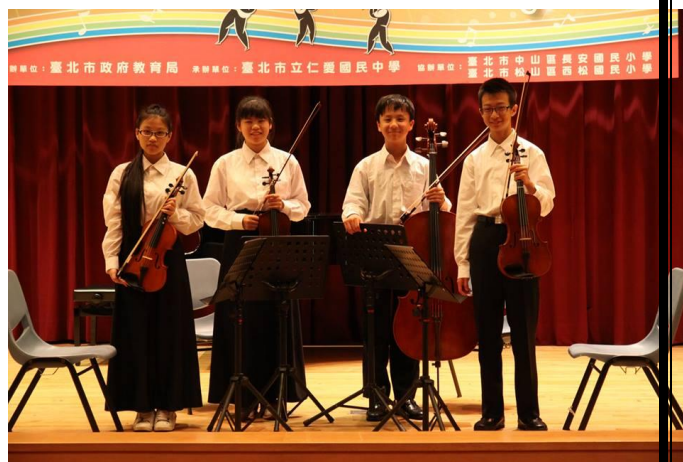
圖說：代表學校參加臺北市學生音樂比賽-室內樂合奏-弦樂四重奏