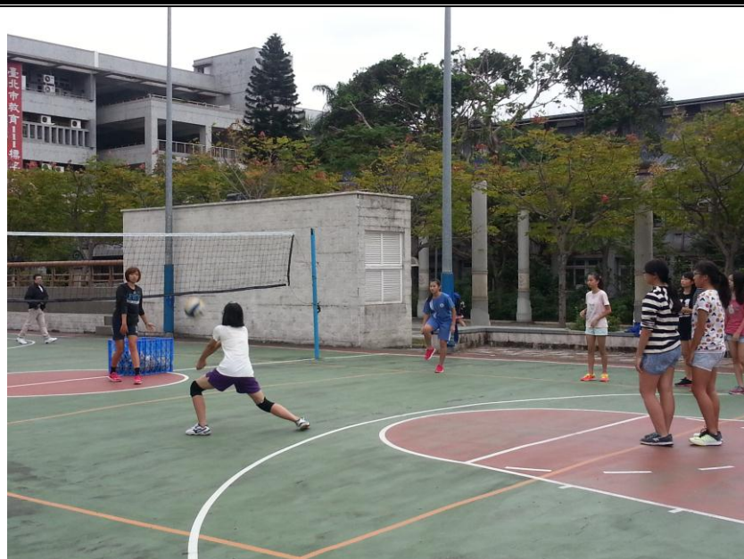
圖說：社團上課情形