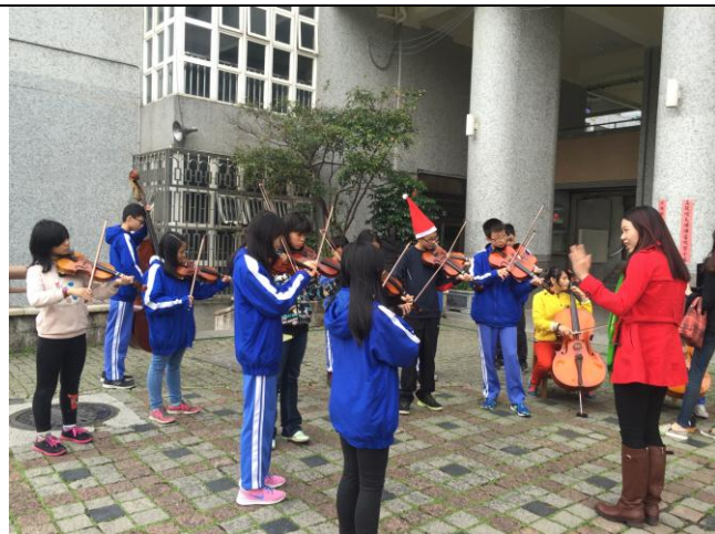
圖說：聖誕節即興校園演出。