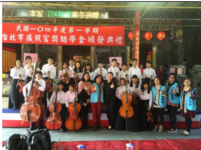
圖說：融入社區，協助廣照宮獎助學金頒發典禮，提供美好的音樂伴奏。