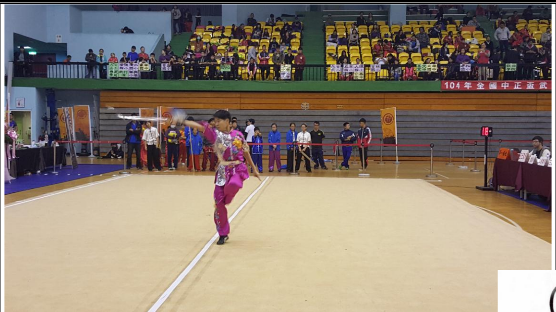
圖說：武術隊參加比賽情形。