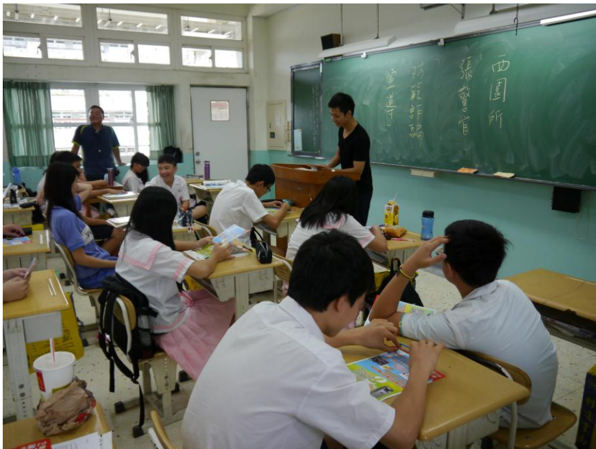
圖說：邀請轄區員警，加強法治教育宣導。